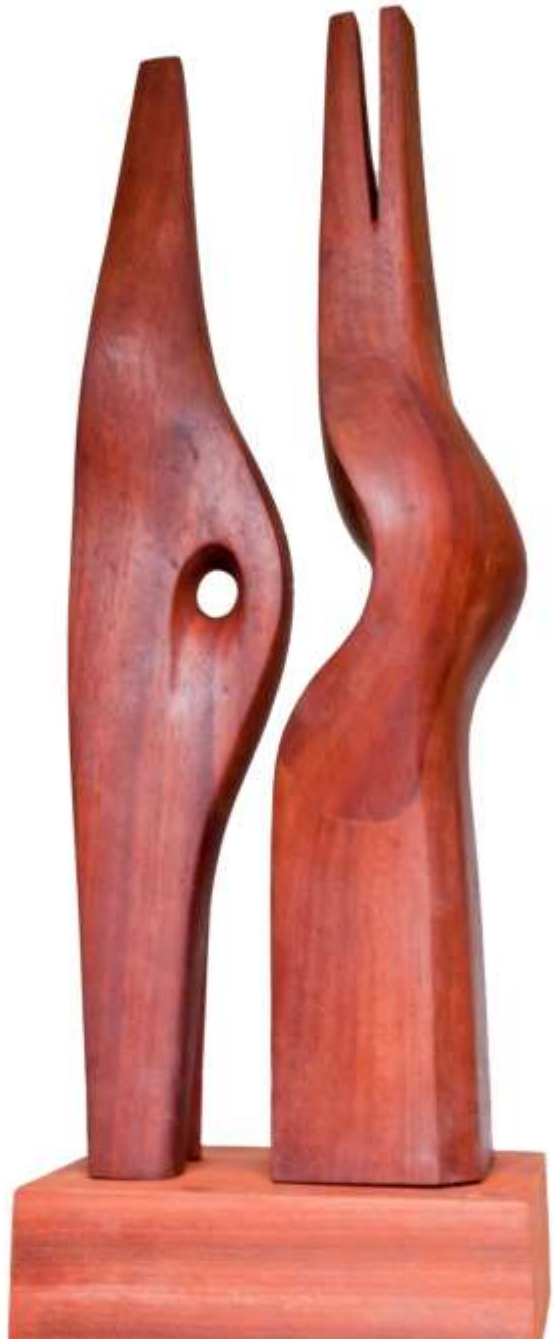
F.922"Serie tallas directas"2020 Madera-59x20x15cm.