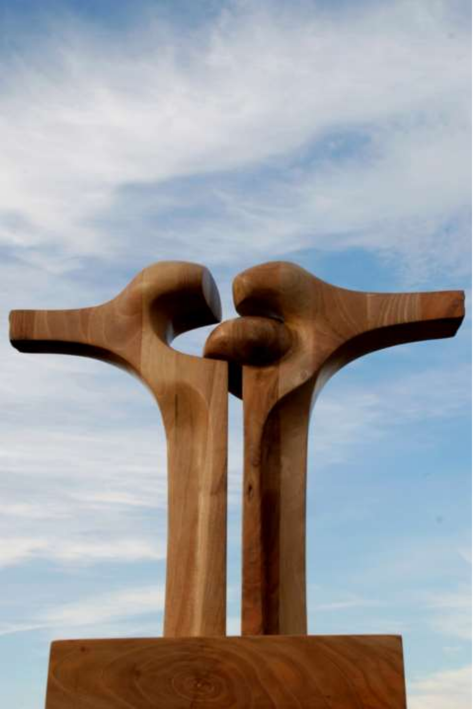
F.706. "Serie Osamentas" 2008. Bronce. 51x51x21 cm. M/9 Madera."""