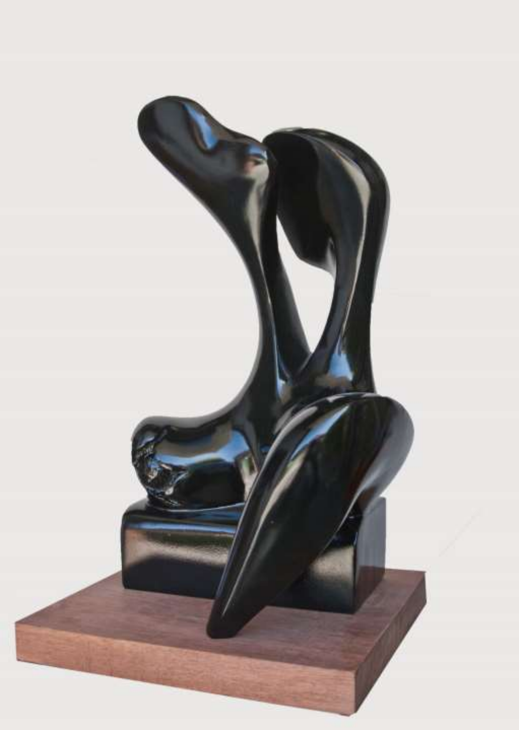
F.554 "Serie Torsos" 1998-Madera.53x32x31 cm.