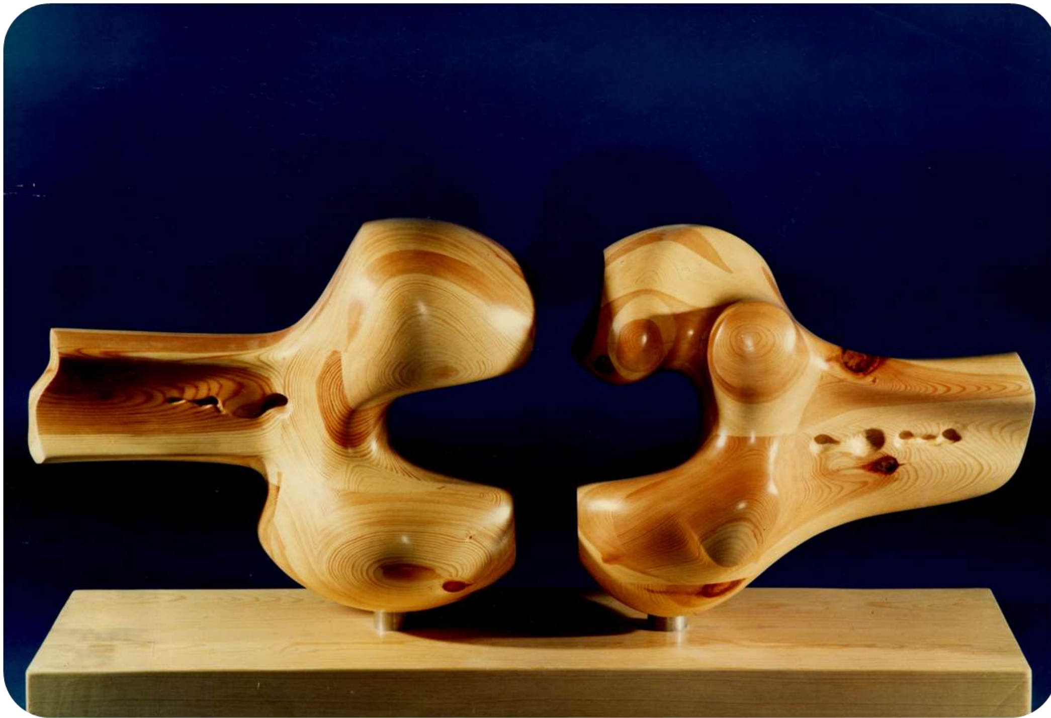
F.456-Madera Premio de la bienal de Pontevedra