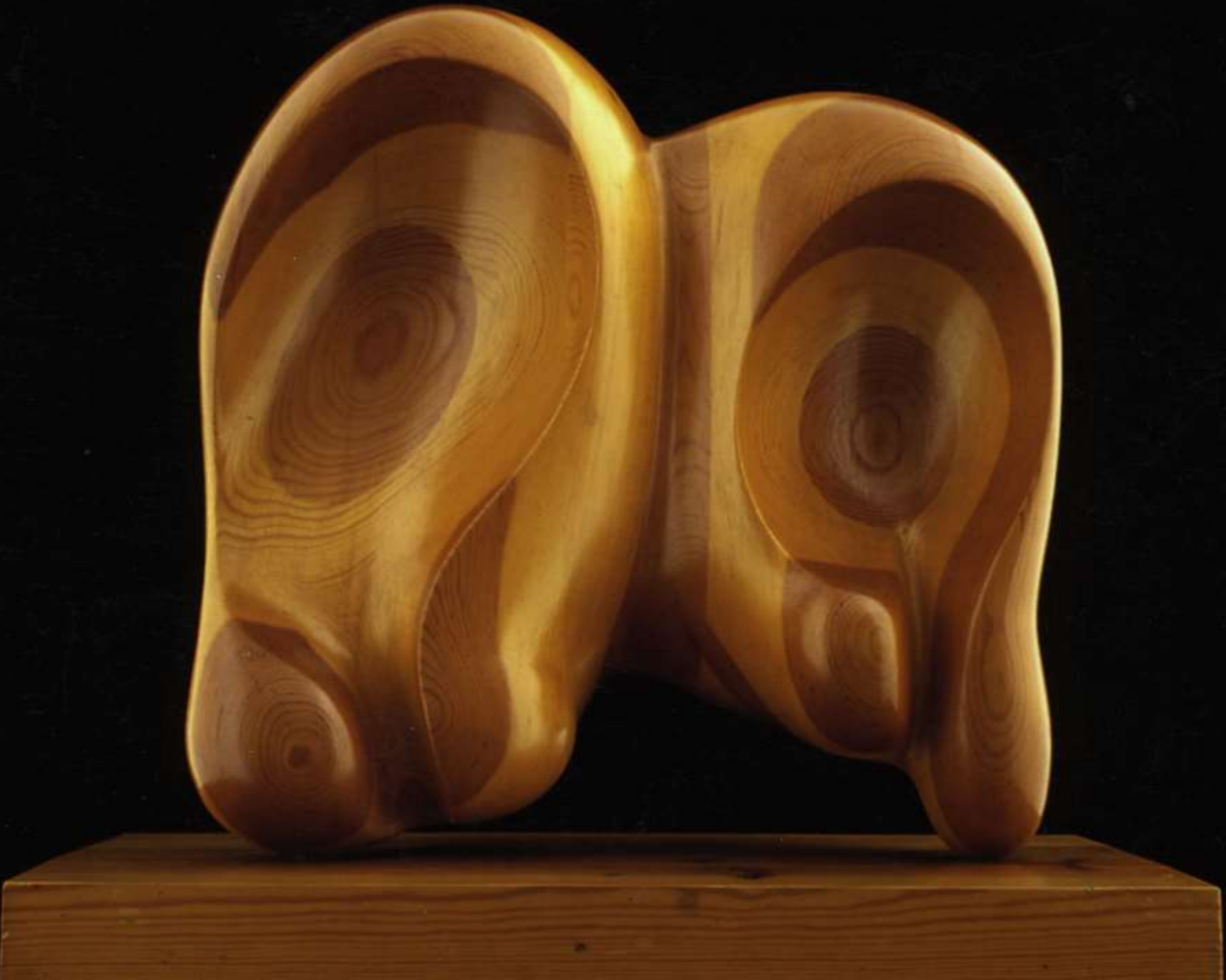
F.26-1976 Madera. 52x51x27 cm.