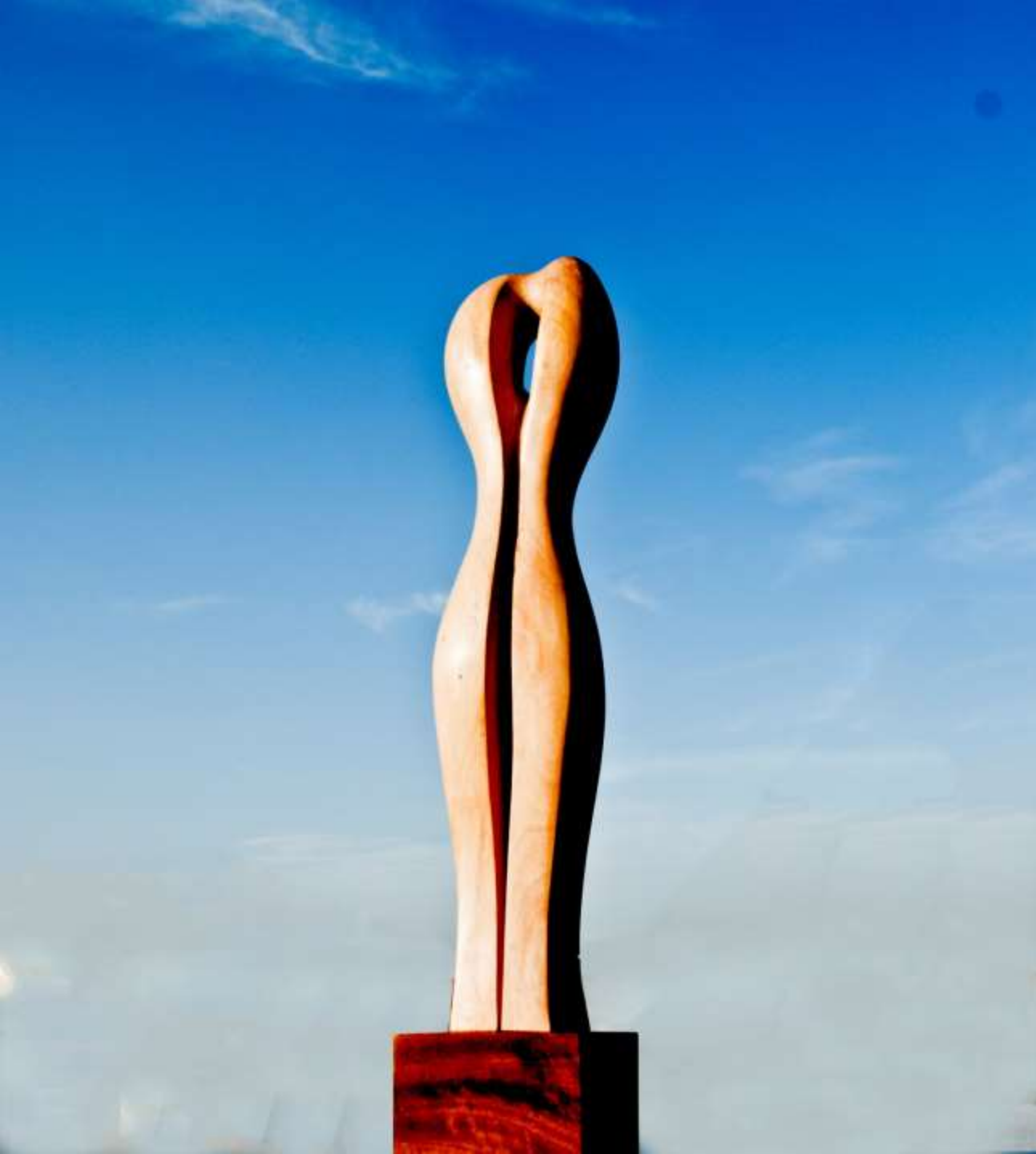
F.830 “Series Orgánicas” 2016-Madera.60x12x12 cm