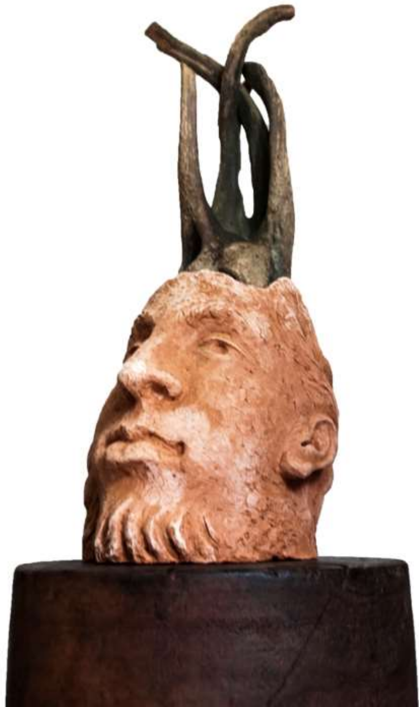
Serie cabezas. Terracota y madera petrificada