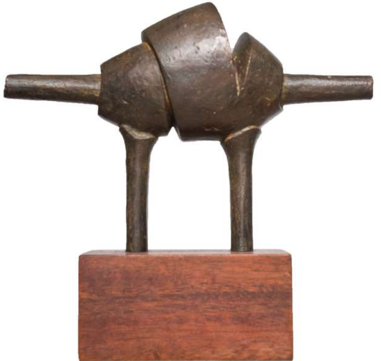
F.657.Serie Orgánicas.año.2005 -Bronce.25x18x11 cm. M/12