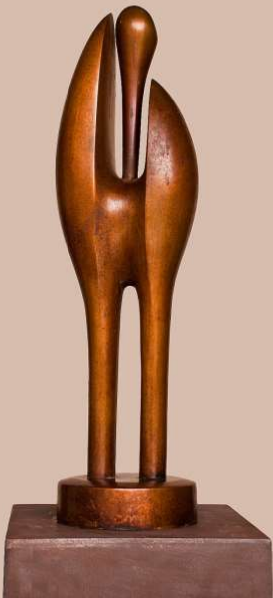
F.527"Serie germinaciones"1996. Bronce 78x20x20 cm.M/8