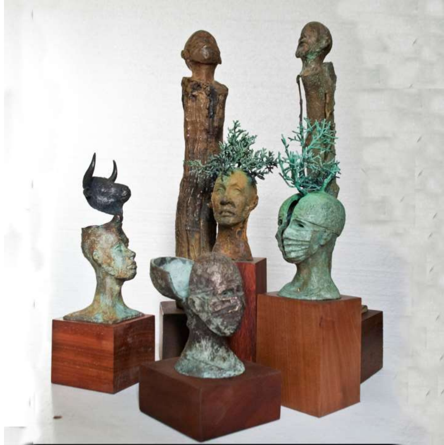
Serie de cabezas arbóreas