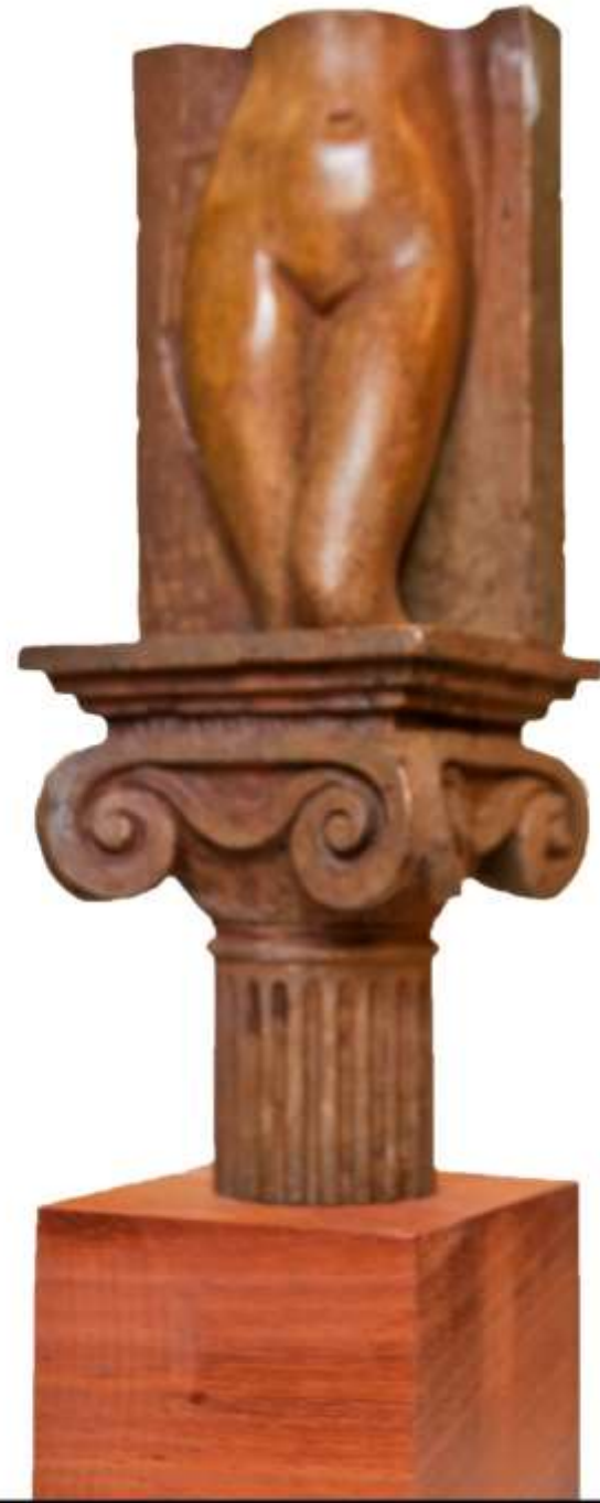
F.960 "Añoranza de época anterior" Bronce 32x9x9 cm.