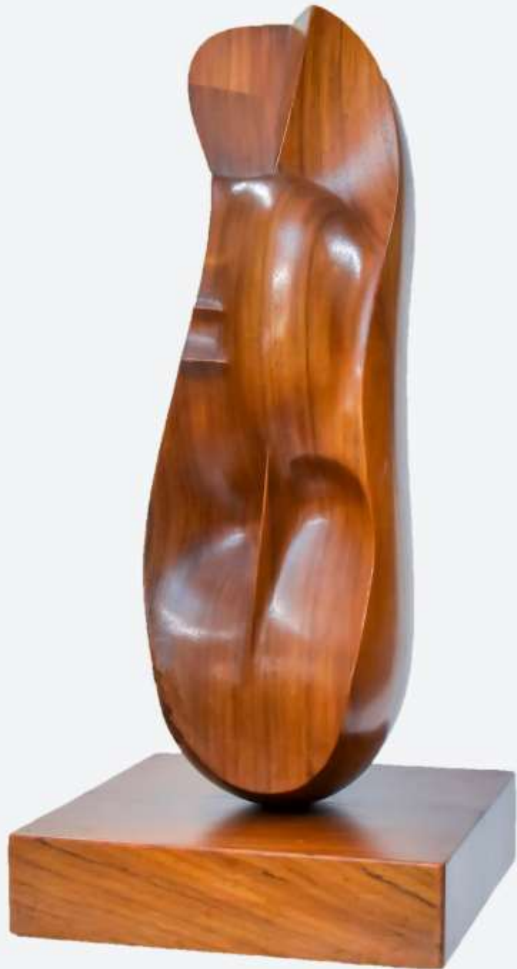
F.41 "Serie Orgánicas" 1974-Madera 75x32x32 cm