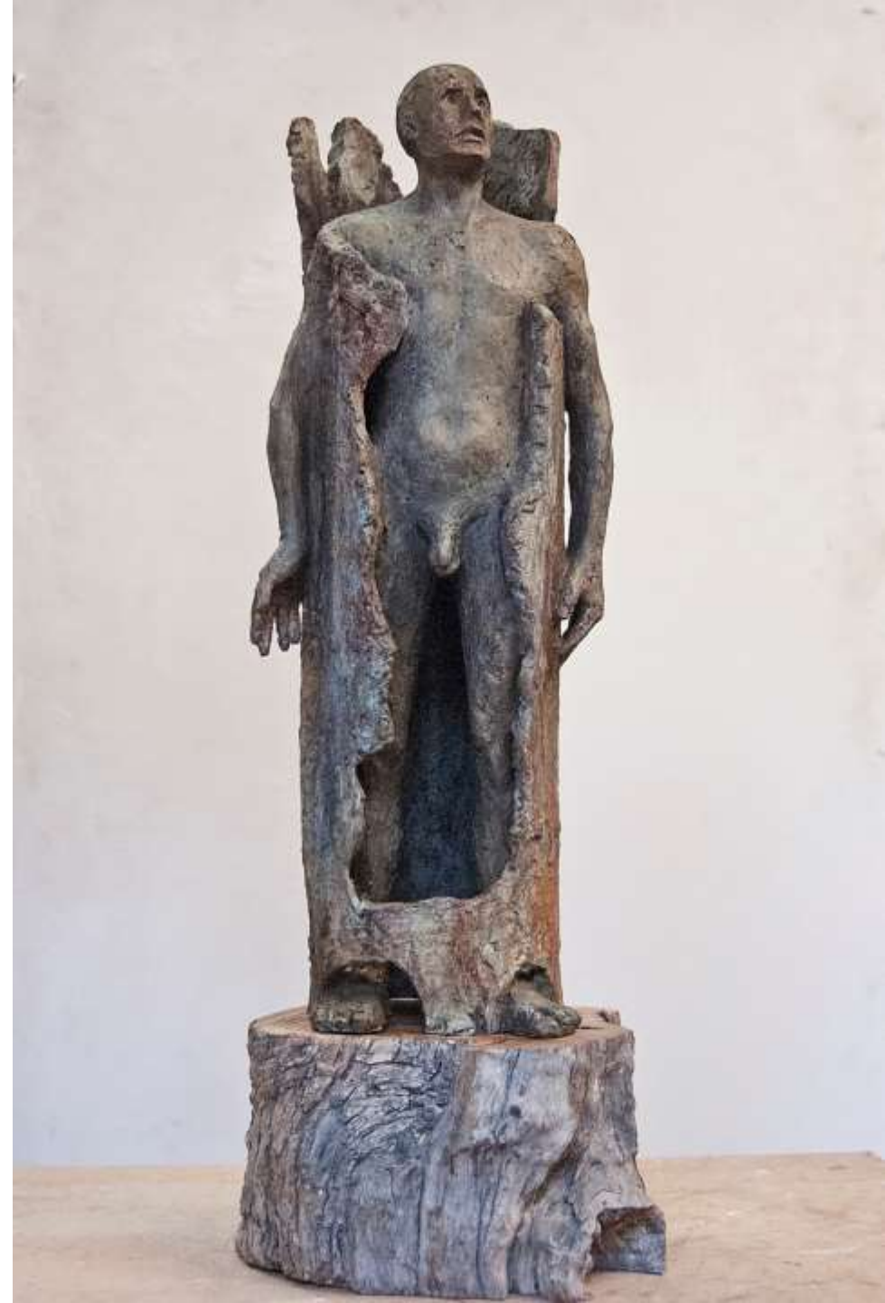
F.877" Hombre saliendo del árbol" 2019- 48x14x14 cm