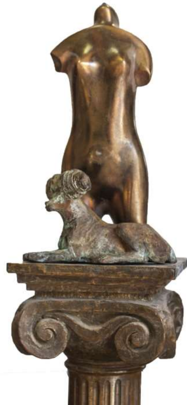
Recuerdos, bronce. 52x9x9 cm. 2023