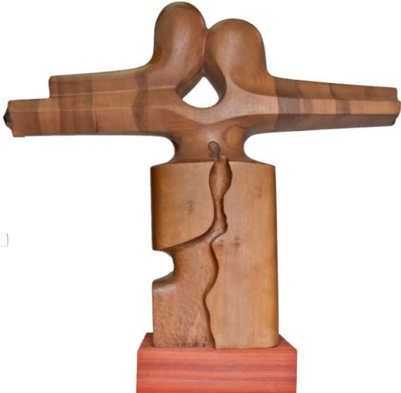
F.82"Serie Encuentros" Madera 52x18x18 cm. Bronce. 18x9x6 cm. M/69