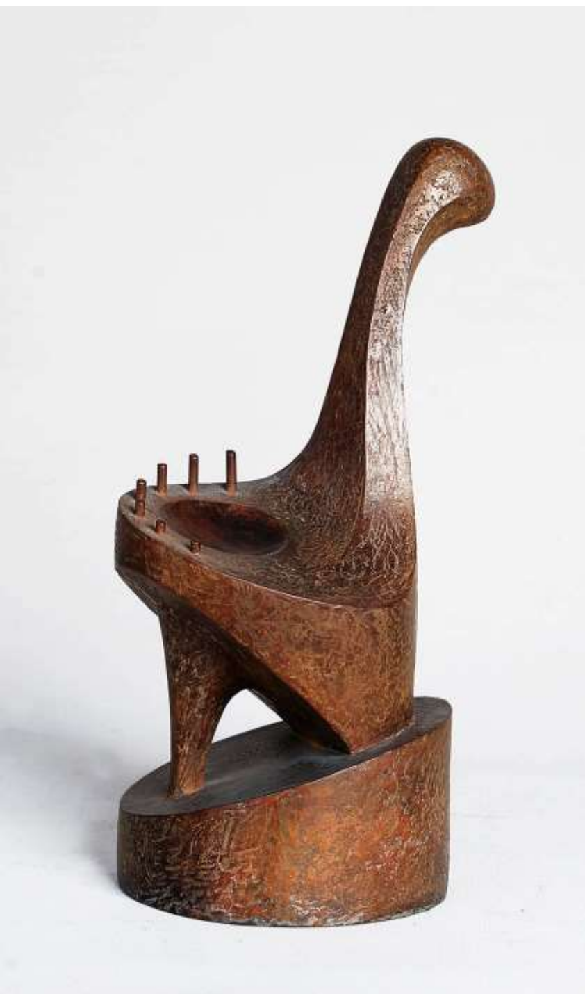
F.660"Serie zoomorfes"2005 Bronze.28x13x12 cm. M/12