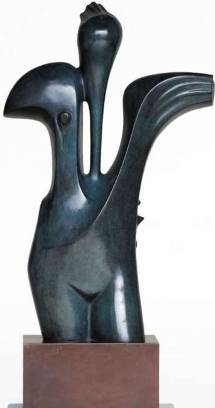
Xana . Hada de las aguas Asturianas.