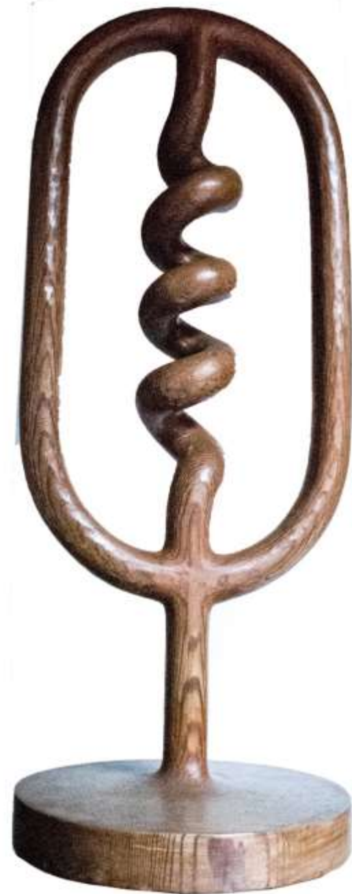
F.369 "S.espirales" 1988-Madera.70x38x26 cm