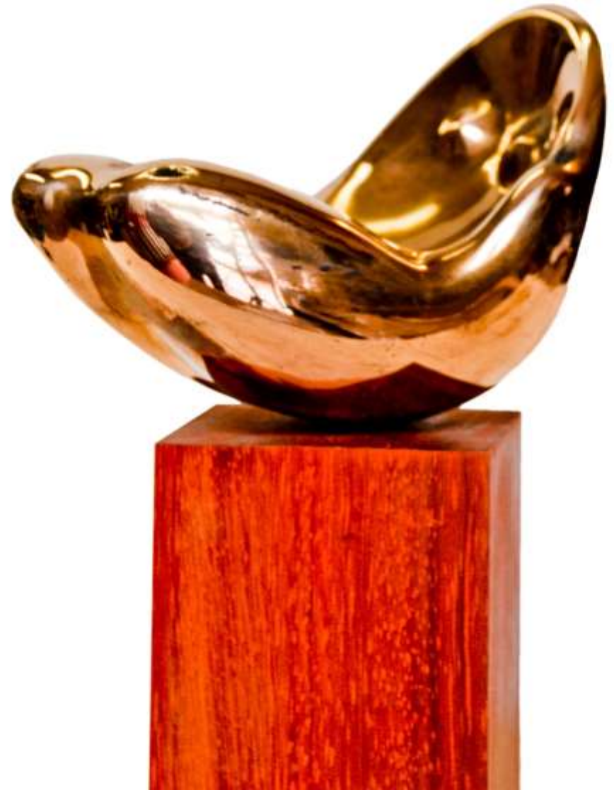
F.59"Serie Torsos"1982 Bronze.12x18x11 cm. M/50