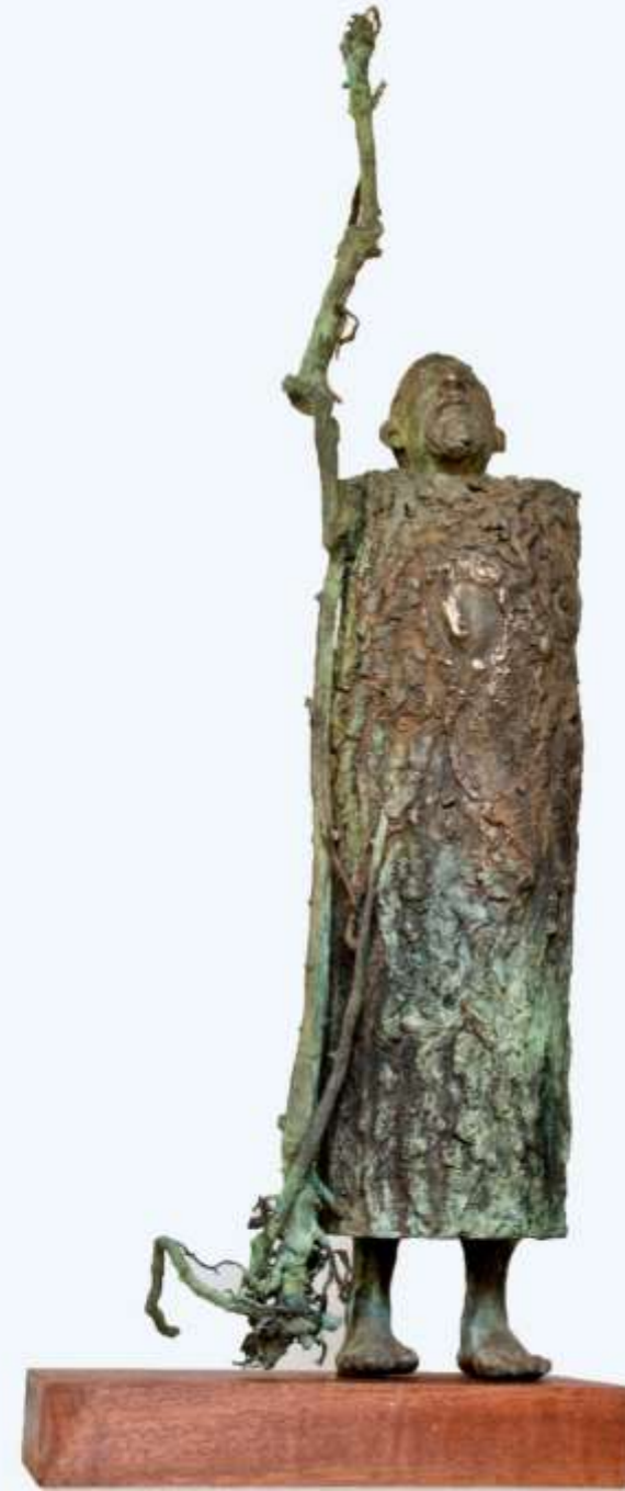
F.867" Paseante" 2018 Bronze. 48x18x11cm. M/9