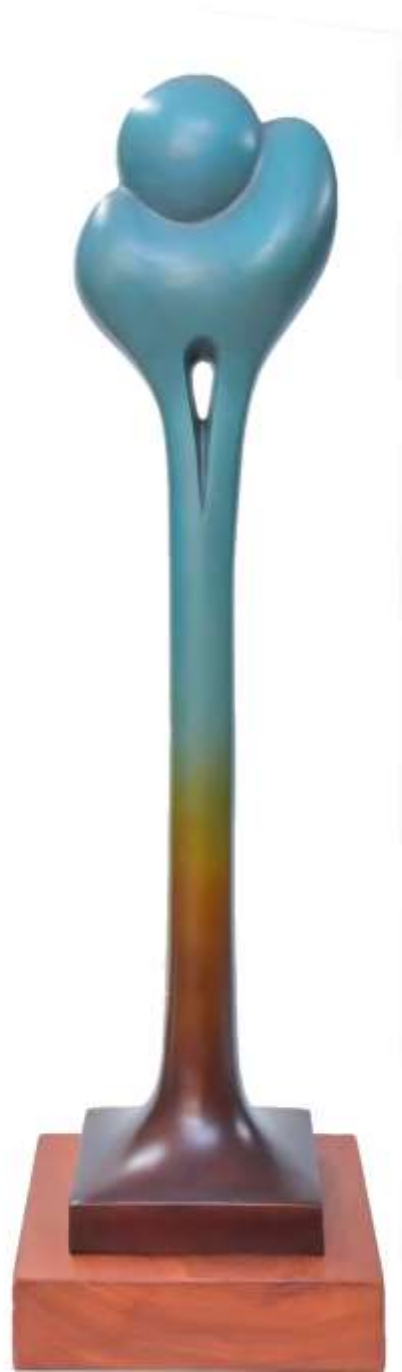
F.827-2"Osamenta vertical"2016-Bronze 90x20x29cm.M/7