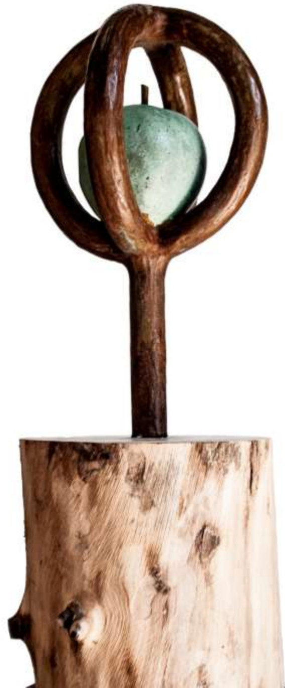
F.925-2"Series manzanas"32x16x16 cm