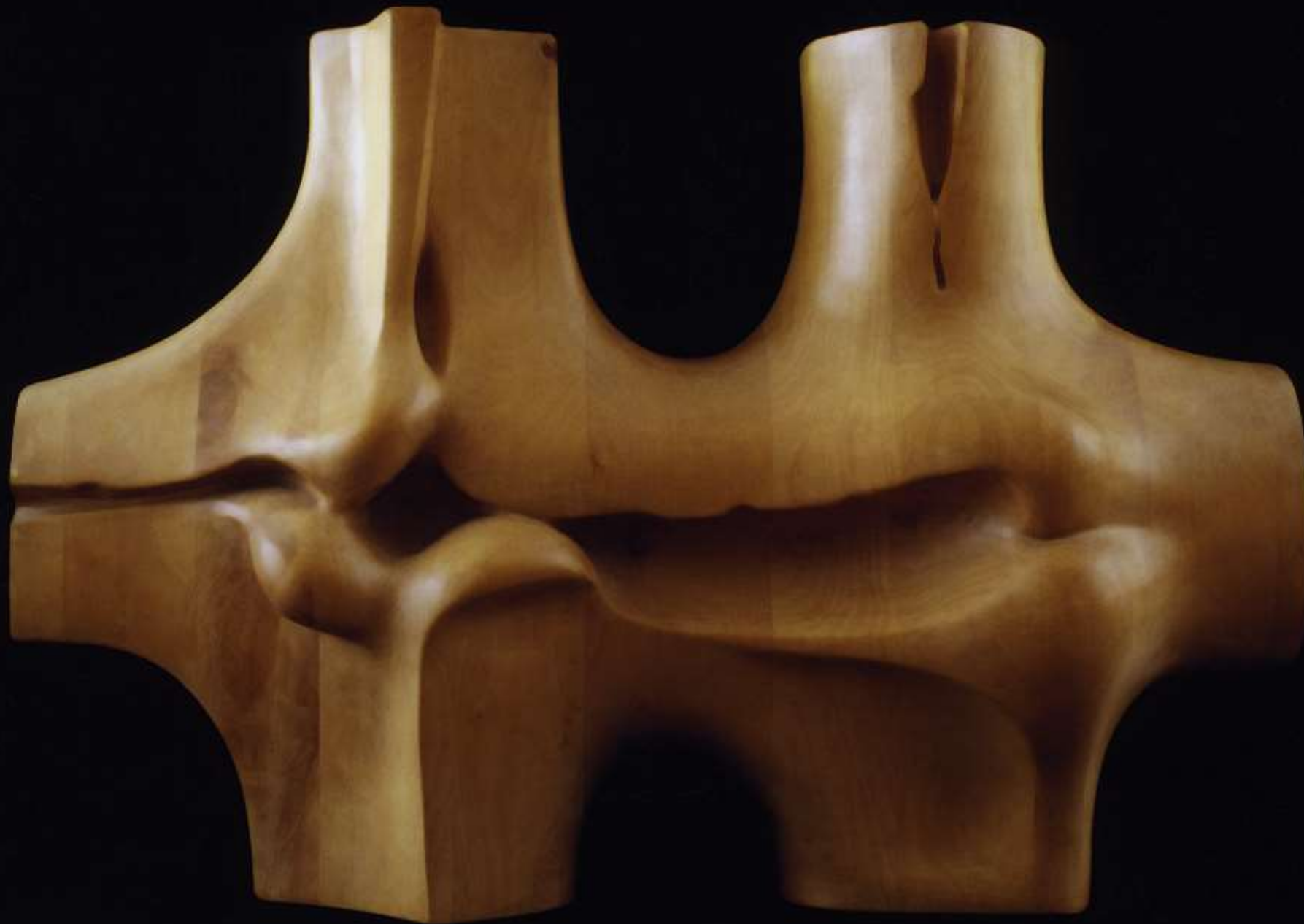
F.6''S.Organicas 1975.Madera. 70x35x50cm