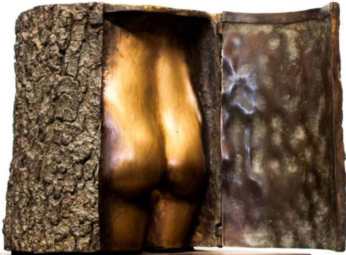
F.455 "Arbol con torso" 1989 Bronce 18x18x22 cm. M/12