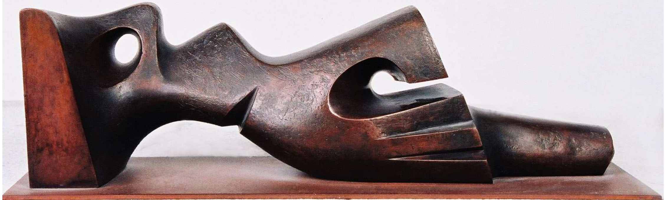
F.577" Serie Torsos "Bronze 2001,47x15x18cm.M/7