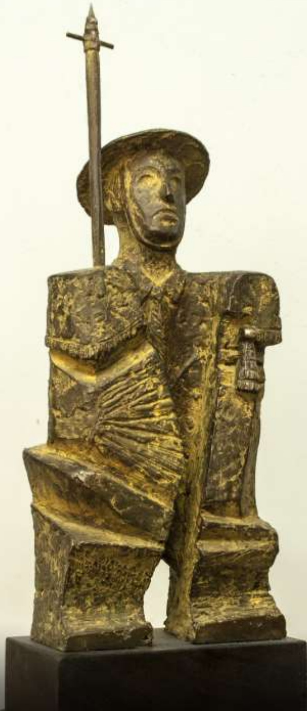
F.812"Picador" colección de temas Taurinos-2015-Bronce.33x12x9 cm. M/12