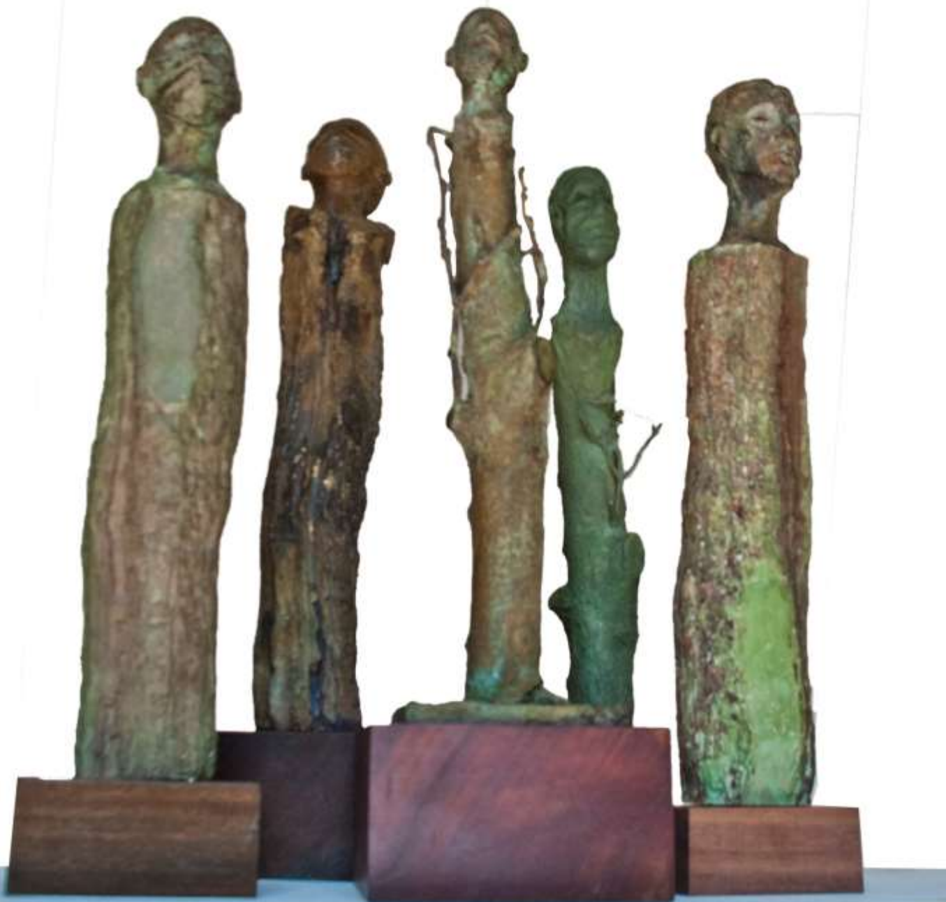
De la serie arbóreas "Cabezas"