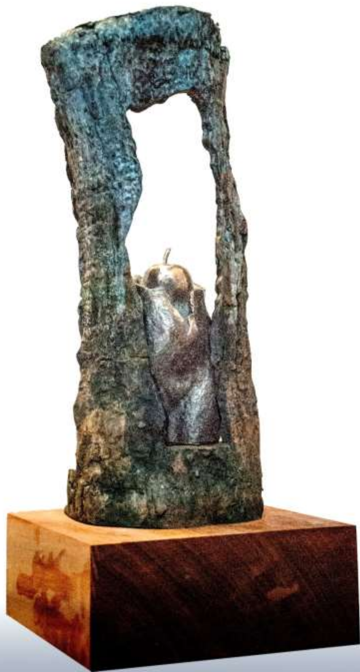
F.878 "árbol de Eva" 2019 Bronce.17x17x30 cm. M/9