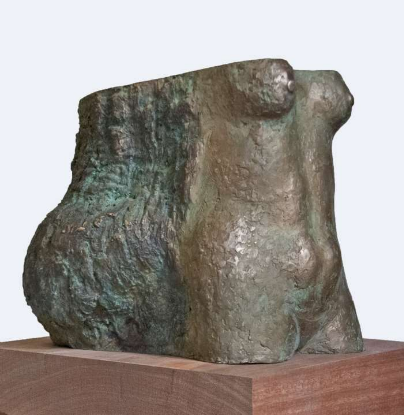
F.879"Torso en el bosque"2019- Bronce.22x19x10cm.—1/8