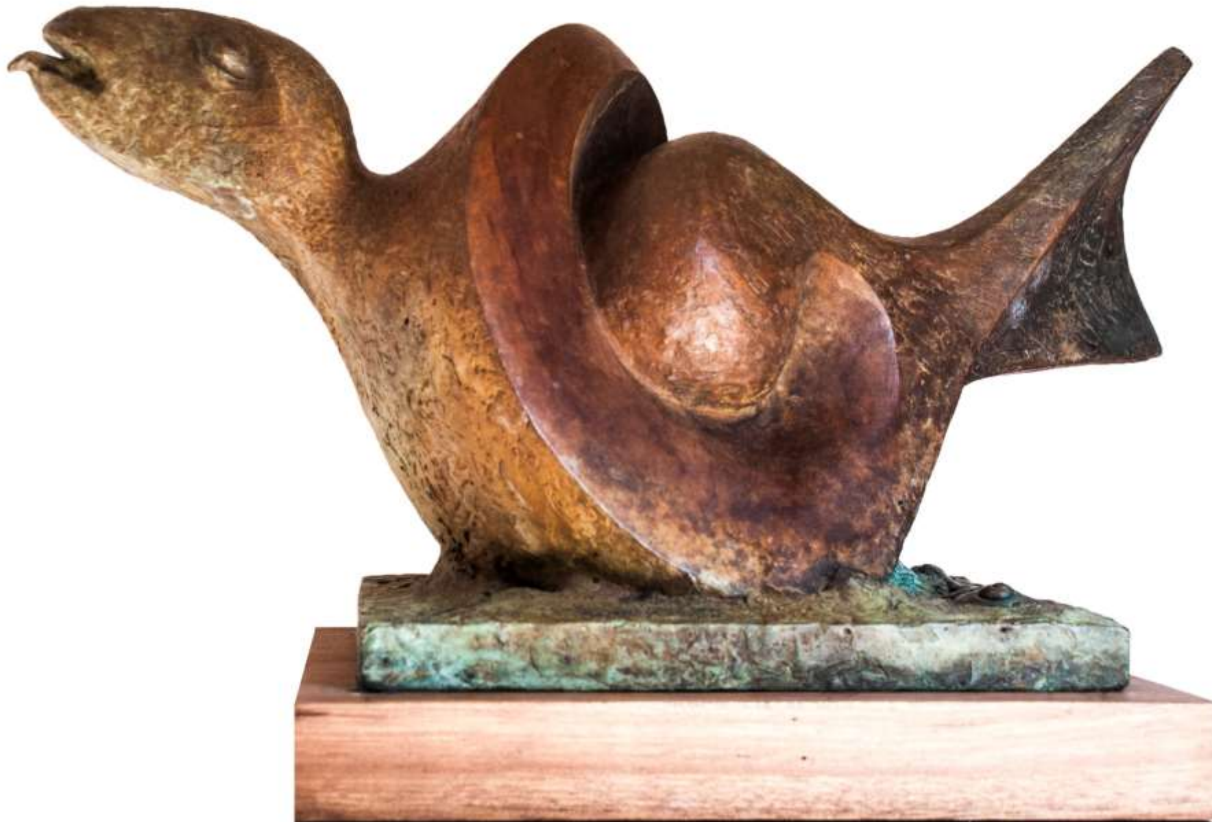
F.921 "Culebre" 1996- bronce. 24x36x12cm. Mitología Asturiana