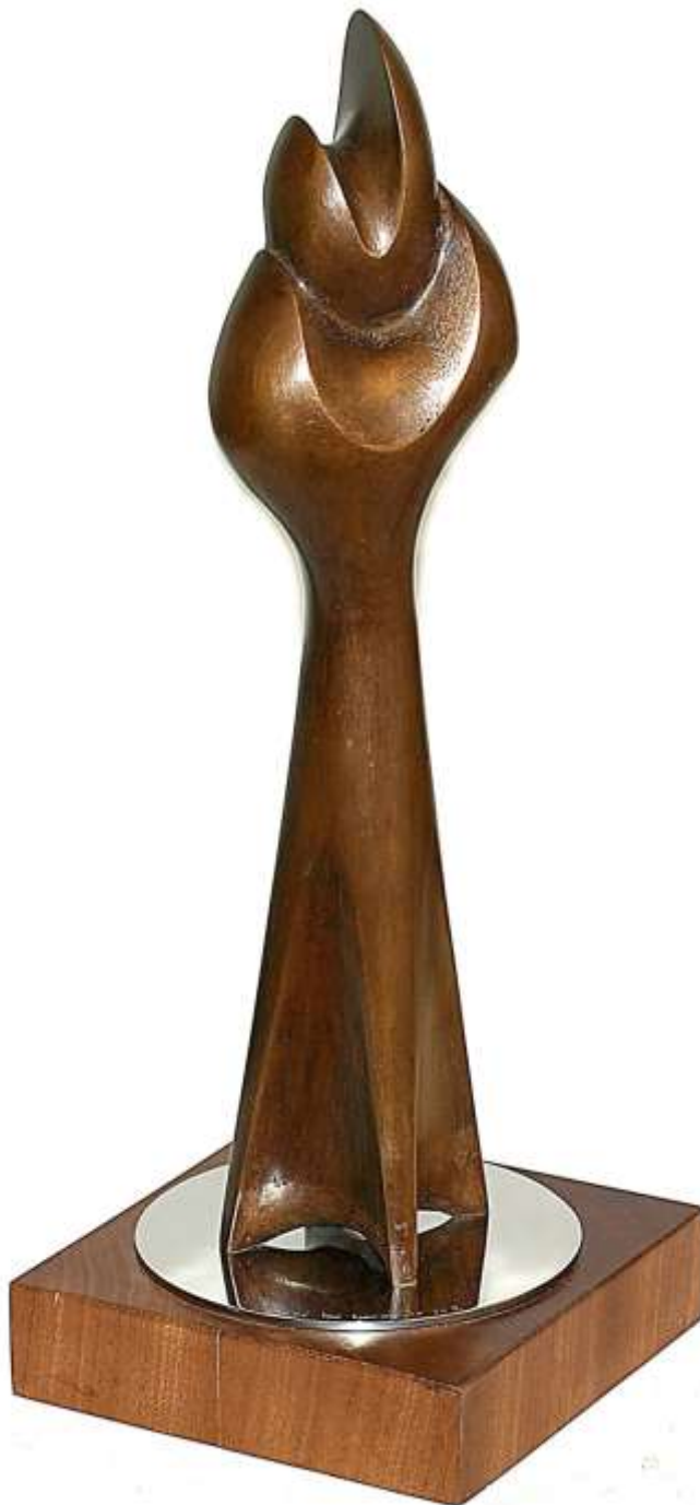
F.183 "S. orgánicas" 1981 Bronce y Madera. 40x23x28 cm.