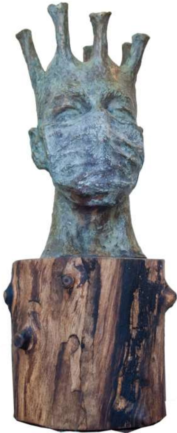
F.914" Covid 19 Bronce sobre madera 32x14x14 cm.2021