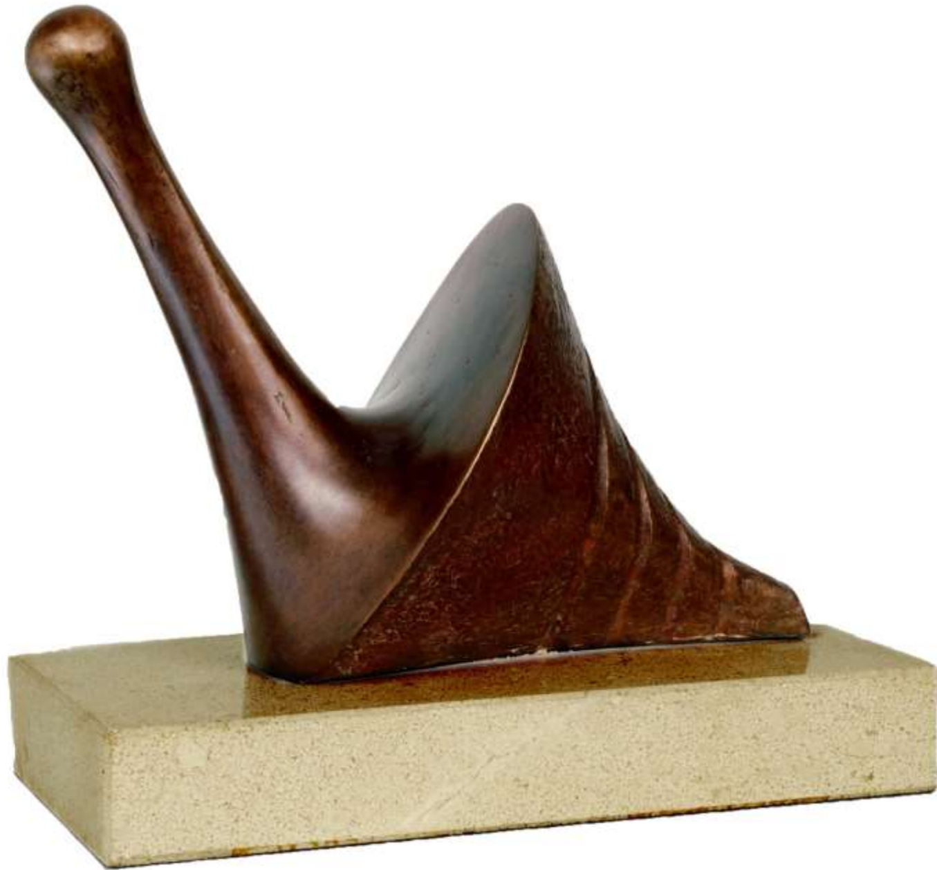
F.695 "zoomorfas" Año 2007-Bronce 18x9x6 cm.