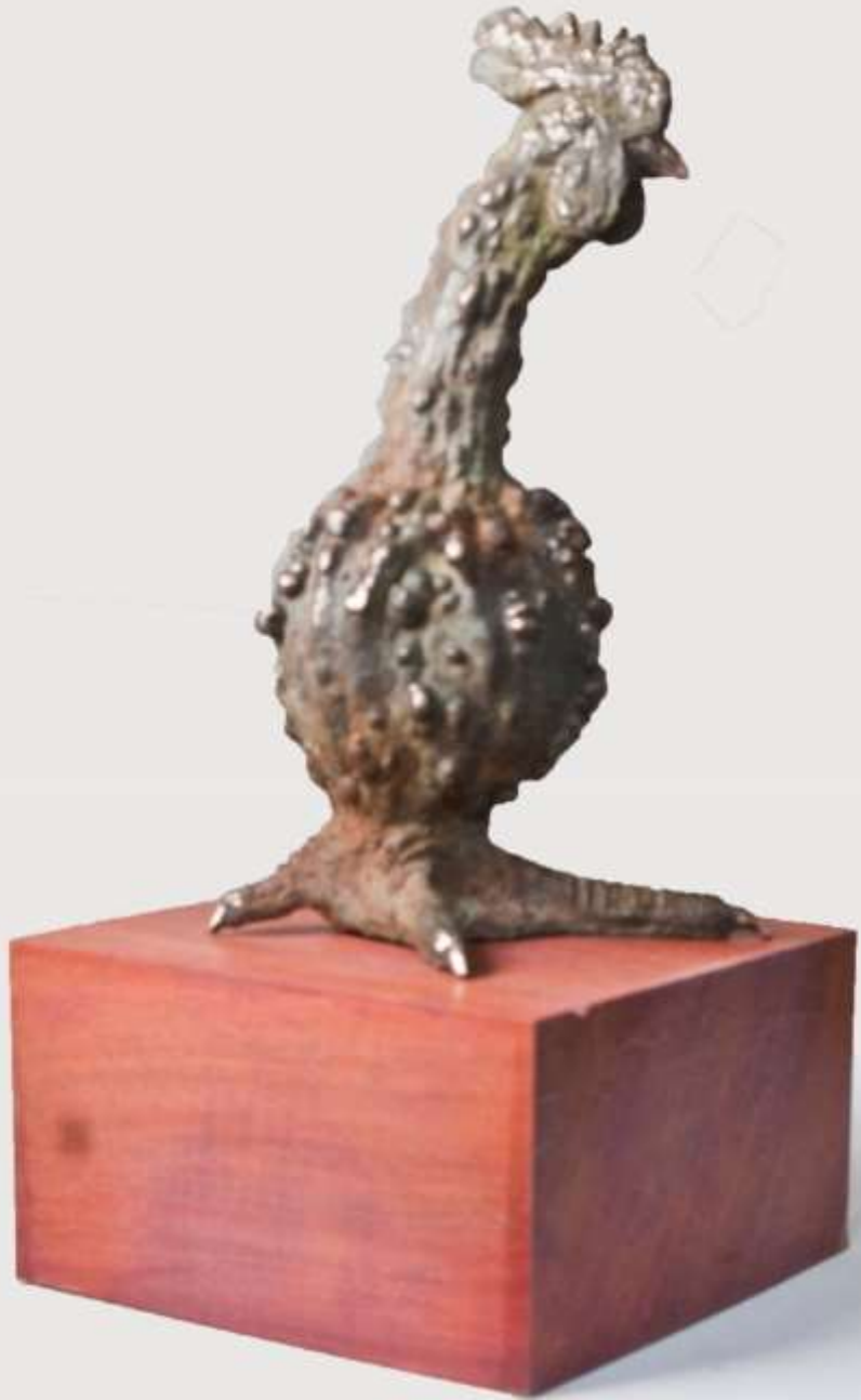
F.874" Calabaza gallinácea" 2018-Bronce.26x12x12 cm.1/12