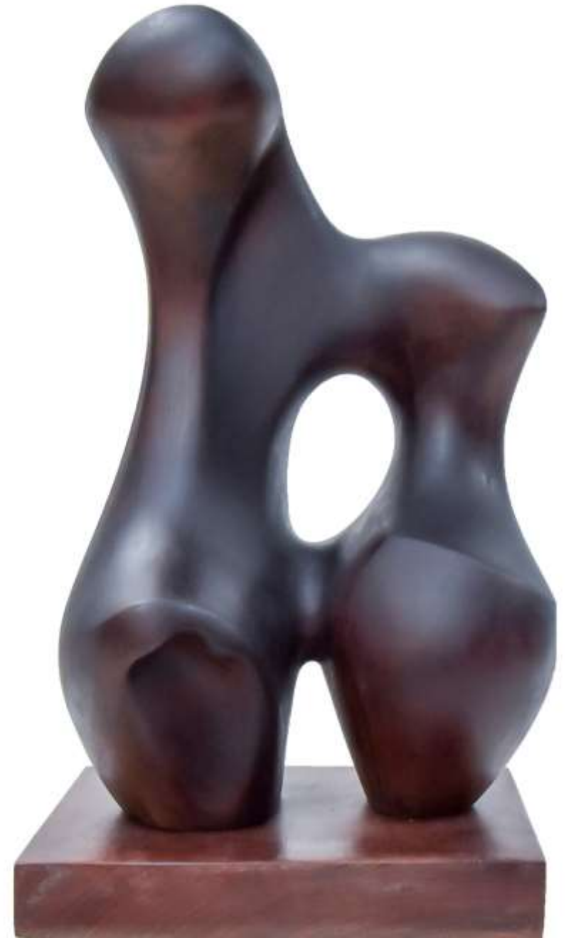
F.79"Serie orgánicas"1977. Bronce.43x24x20cm.