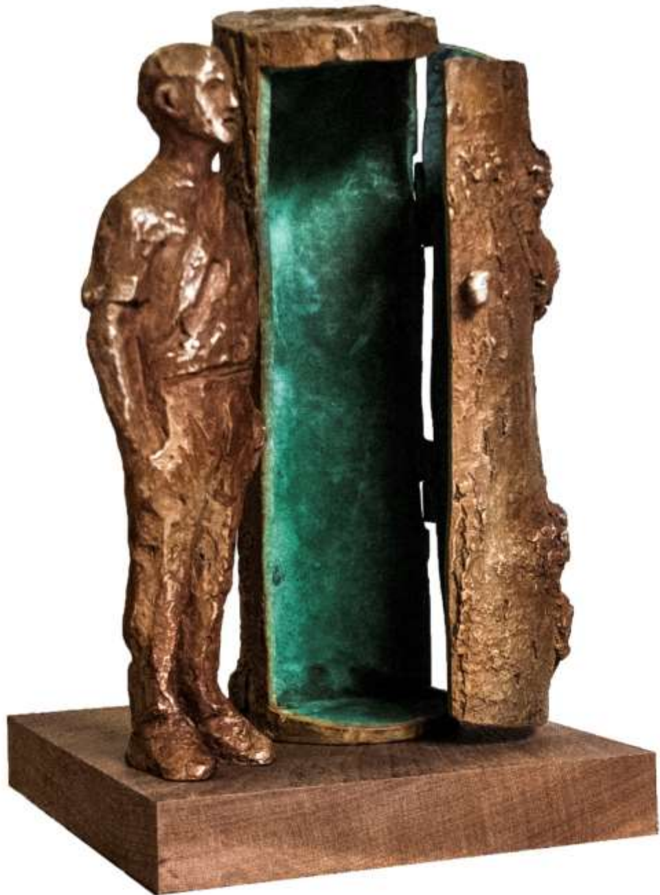
F.870 "Hombre y árbol" Bronce.25 x14x14 cm.2018-1/9