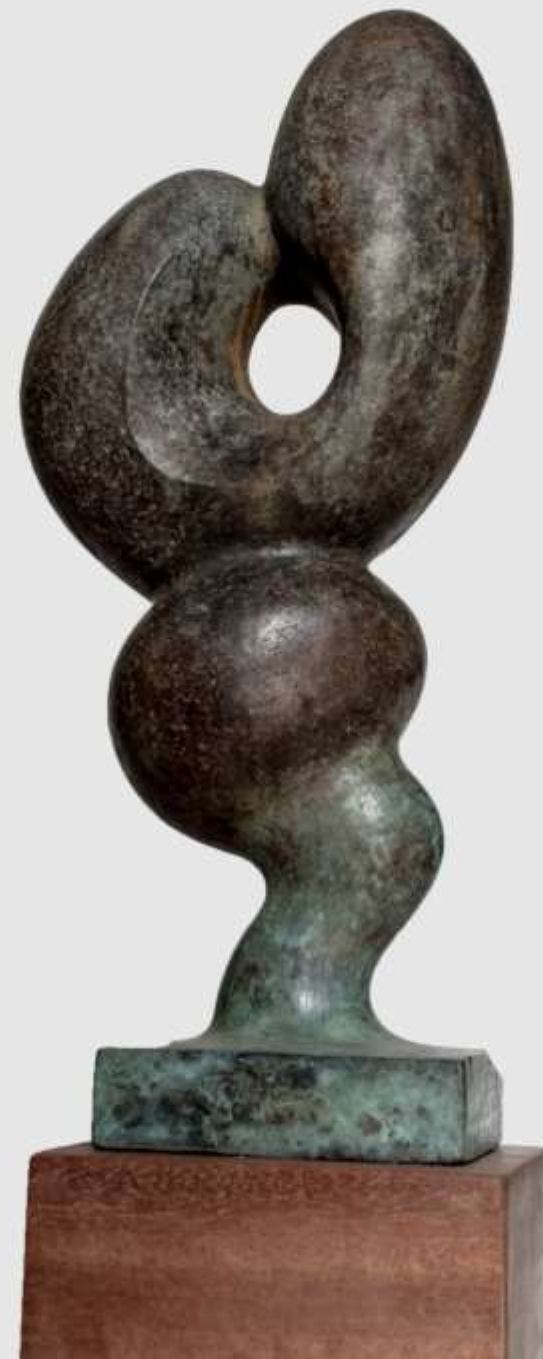
F.194-2" Serie Orgánicas" 1982 Bronce 33x9x9 cm. 10/12